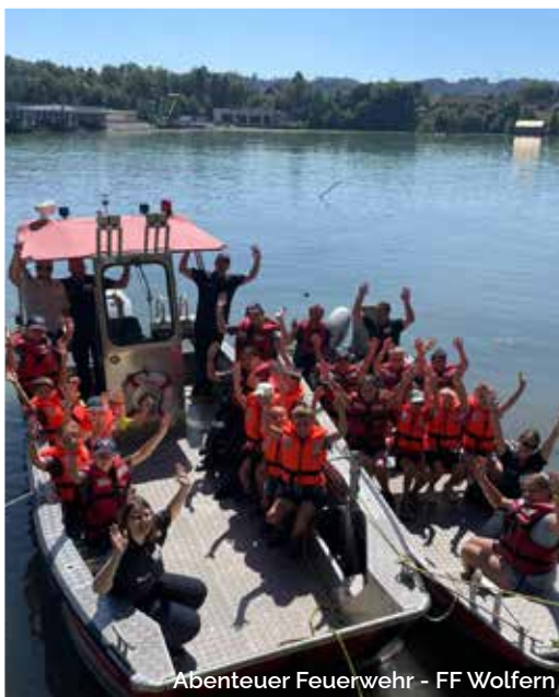
Abenteuer Feuerwehr - FF Wolfhern