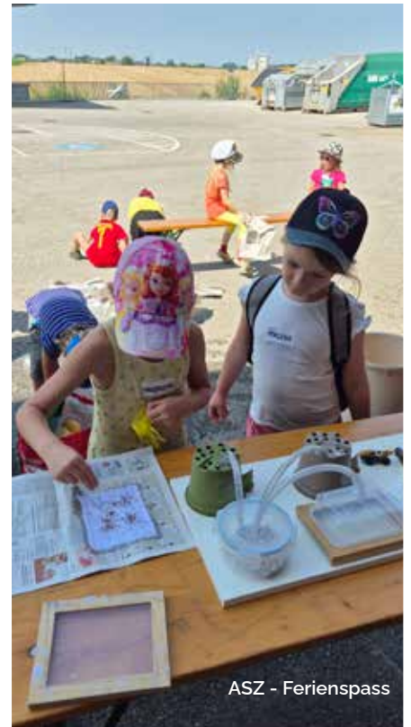
ASZ - Ferienspass