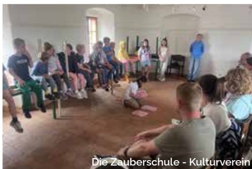
Die Zauberschule - Kulturverein