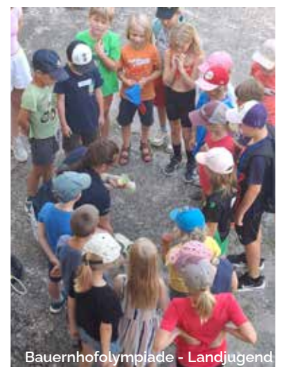
Bauernhofolympiade - Landjugend