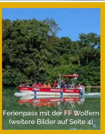
Ferienpass mit der FF Wolfers (weitere Bilder auf Seite 4)

HERBSTPROGRAMM 2025 Anmeldung ab Do, 04.09.2025 möglich! Seite 8-9