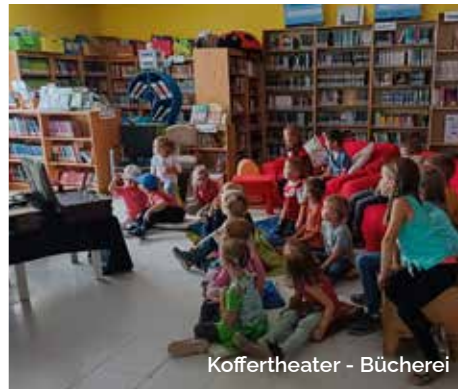
Koffertheater - Bücherei