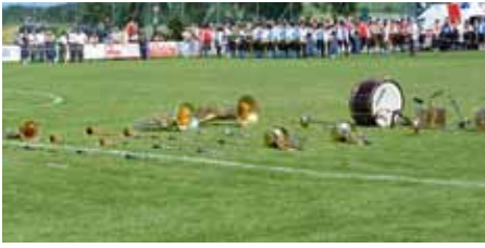
Wo sind die Musiker - vielleicht im Zelt!?

Als Gegeneinladung fuhr der Musikverein Wolfhern zur Marschmusikwertung in den Bezirk Perg zum Musikfest der Musikkapelle Katsdorf.