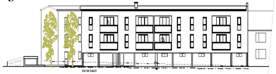
Ansicht zur Schulstraße

Am Montag, 27. Februar 2012 wird um 19:00 Uhr am Marktgemeindeforum Wolfers das Projekt vorgestellt. Sie erfahren die Details zu den Kosten, zur Größe und Ausstattung.