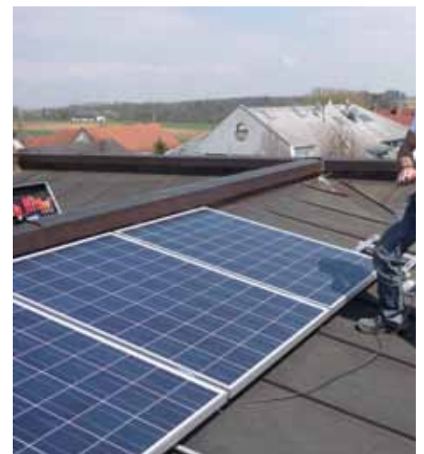
Auf den Dächern von Wolfern

Das ist auch die Motivation für den garantiert aufschlussreichen Vortrag zum Thema Photovoltaik für alle Privatpersonen. Großes Know How und neueste Informationen (zB Speichermöglichkeit) erwartet alle Besucher. Die E-GEM Gruppe freut sich auf Ihr Kommen.