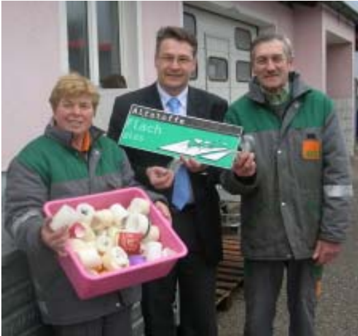
Im Altstoffsammelzentrum können auch Kerzen entsorgt werden. Angenommen werden alle Arten von Wachs-, Stumpen-, Kugel-, Stab-, Spitz-, Christbaumkerzen, Teelichter,

Schwimm-, Duft-, div. Zierkerzen, Fackeln (Garten-, Hand- und Partyfackeln), Outdoorkerzen wie Gelsenlichter, Mückenlicht, Schalenkerzen (ohne Alu- und Tonschalen).