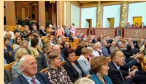
Die Schöpfung von Joseph Haydn - Kulturfahrt nach Wien