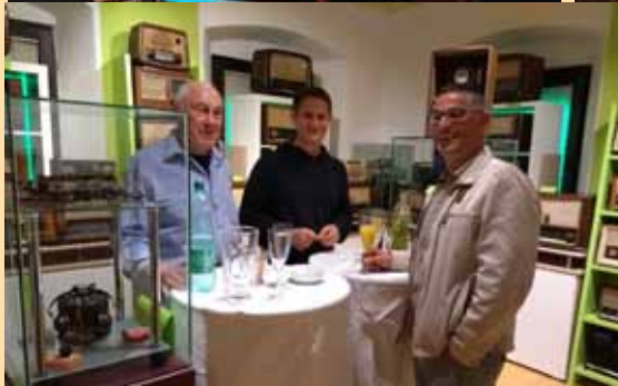
Lange Nacht der Museen mit mehr als 60 Besuchern