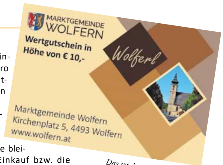
Das ist der neue "Wolferl!"

Alle Betriebe, Dienstleister, Direktvermarkter etc., die von der Aktion profitieren möchten, sind