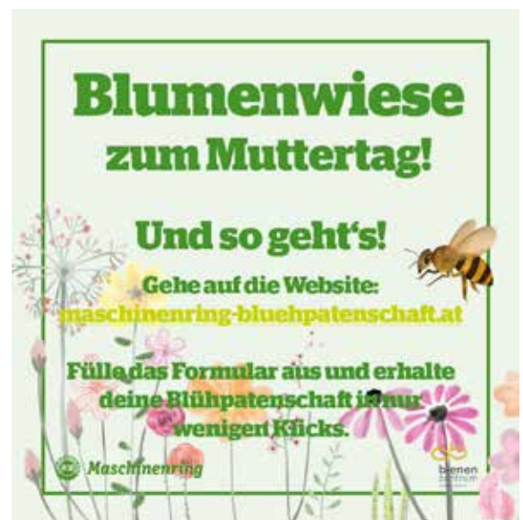
Suchen Sie ein besonderes Geschenk zum Muttertag? Auf maschinenring-bluehpatschaft.at kommen Sie zur nachhaltigen Geschenkidee.