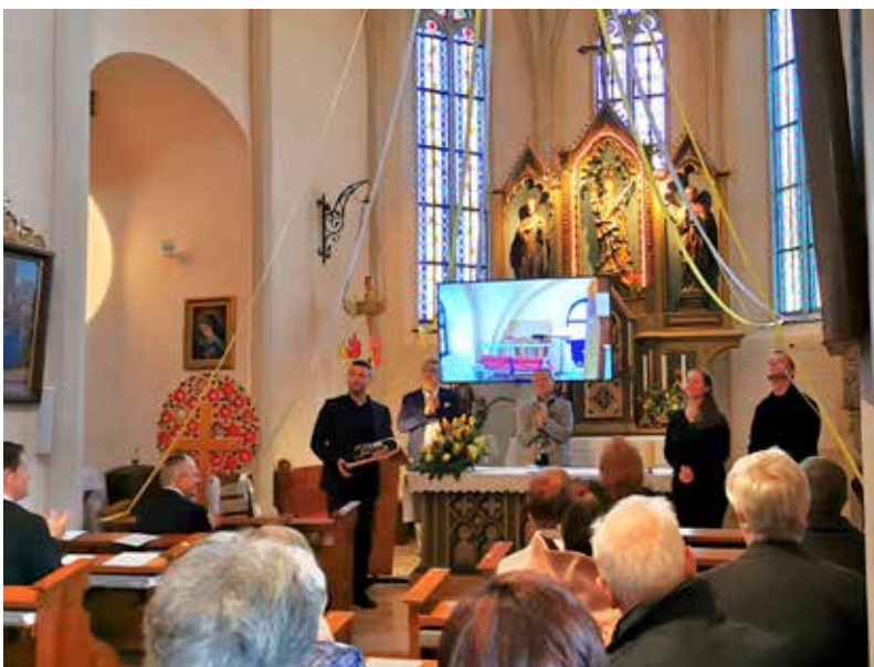
Zahlreiche Besucher folgten der Einladung von Kulturverein Wolforn und Pfarre Maria Laah zum festlichen Kirchenkonzert.