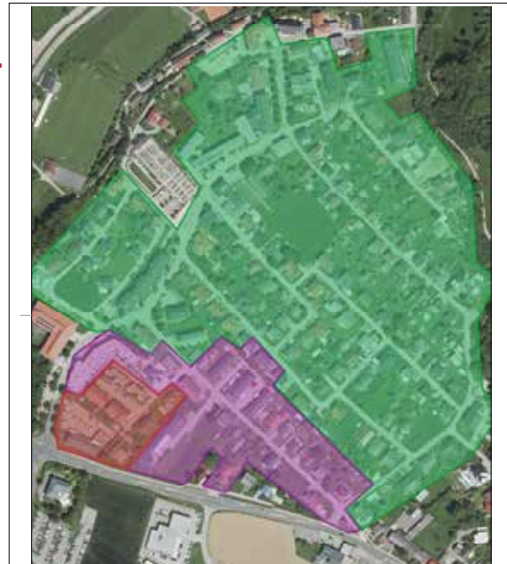
grün - aktuelles Ausbaugelände violett - bereits mit Glasfaser versorgt rot - nächste Ausbaustufe

Wenn Sie noch Fragen zur weiteren Vorgehensweise haben, oder Interesse an der Errichtung eines Glasfaseranschlusses (im grünen Bereich der Skizze), dann melden Sie sich bitte bei der Breitband OÖ unter der Nummer 0732/257 257 8050 oder per Mail an service@bbooe.at .