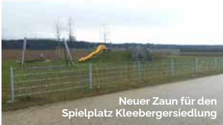
Neuer Zaun für den Spielplatz Kleebergersiedlung

gemeinde beim Land OÖ lukrieren kann sowie für zukünftige Nutzungsmöglichkeiten. Zusätzlich zur Nutzung als Veranstaltungsstätte soll die Gastronomie wiederbelebt werden. Weiters ist geplant, drei Krabbelgruppen in den Räumen unterzubringen. Im Anschluss an die Planungsarbeiten beginnt der Umbau. Im kommenden Jahr werden aber noch einige Feste im Veranstaltungssaal stattfinden - siehe Veranstaltungskalender.