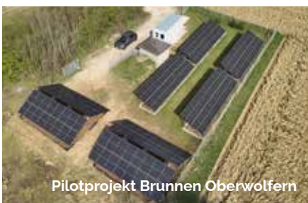
Pilotprojekt Brunnen Oberwolfers

Wir können auf ein ereignisreiches Jahr 2024 zurückblicken. Zu den traditionellen Veranstaltungen unserer Vereine gesellten sich das Bruckner Jubiläumsjahr, 30 Jahre Marktgemeinde, die OÖ Ortsbildmesse und mehrere Vereinsjubiläumsfeste. Als Bruckner-Ort veranstalteten wir mit dem Kulturverein den Brucknerfrüh-schoppen, gestalteten mit den kreativen Beiträgen der Volksschüler den Brucknerweg und der Kulturverein lud zum Konzert mit der Ungarischen Kammerphilharmonie im Rahmen des Festwochenendes zur 30-jährigen Markterhebung und der Ortsbildmesse ein. Mit Stolz blicke ich auf ein großartiges Wochenende zurück. Die Anstrengungen wurden mit durchwegs positivem Feedback unserer Gäste aus ganz Oberösterreich und viel Lob belohnt. An dieser Stelle nochmals mein großer Dank an alle Vereine, Organisationen und Helfer. Nur mit eurem Einsatz wurde unser Marktfest zu diesem großartigen Erfolg.