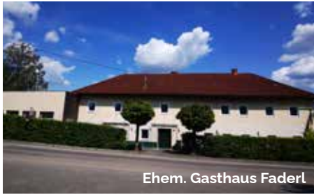
Ehem. Gasthaus Faderl