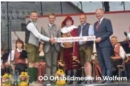
OÖ Ortsbildmesse in Wolfers