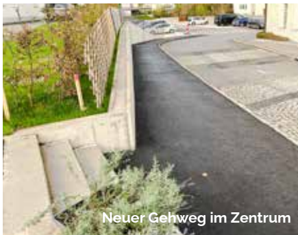
Neuer Gehweg im Zentrum