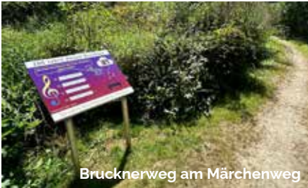
Brucknerweg am Märchenweg