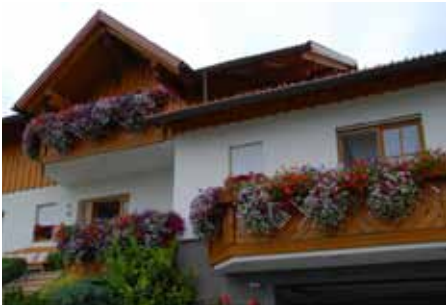
Das schönste Wohnhaus

Sie schicken einfach 5 bis 10 Fotos von 2015 zu einer der Bewertungskategorien per Post (OÖ Garten Trophy, Landwirtschaftskammer Linz, Auf der Gugl 3, 4021 Linz oder per Mail an gartentrophy@lk-ooe.at) ein und schon können Sie gewinnen. Anmeldeschluss ist der 30. Juni 2015. Folgende Kategorien werden bewertet: