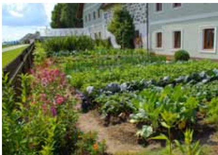
Der schönste Gemüsegarten