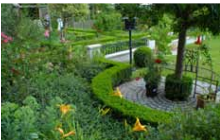
Der schönste Garten