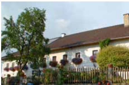
Das schönste Bauernhaus